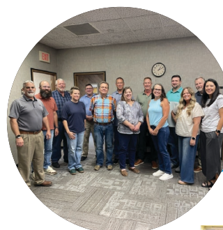
IT 团队一起参加寻宝游戏