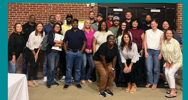
位于北卡州 Conover 的 Hanes 分公司的 Foundational Leadership 项目的班级

我们感谢每一位参与 Foundational Leadership 项目并致力于让自己和其团队得到提升的领导者！