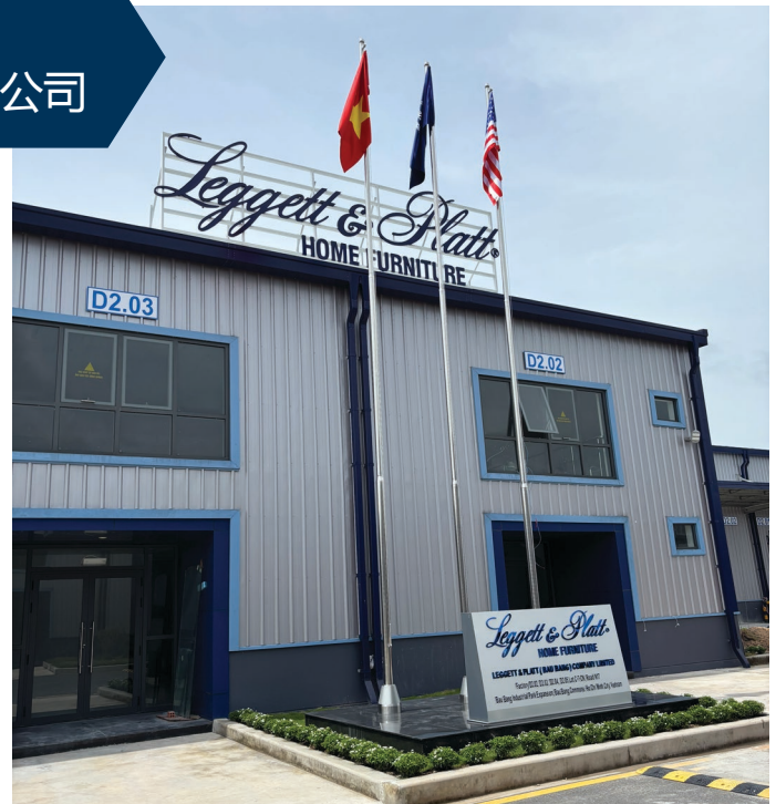
位于 Bàu Bàng 的 Leggett & Platt Home Furniture 分店的外观