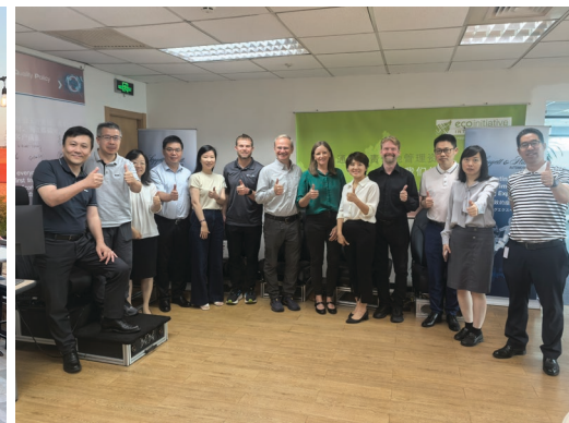
L&P 国际贸易公司 (L&P International Trade), 中国

我们也在通过 LPVoice 来进行倾听并采取行动。当我们去年底推出 LPVoice 时，我们收到了 8,000 多份调查回复，这些回复让我们深入了解了我们做得好的地方以及有待改进的地方。业务单位和公司部门领导利用这些反馈制定了能够加强员工的认可、提供更多的增长和发展机会、增加参与度和协作的个性化的行动计划。今年晚些时候，我们的企业人力资源团队将检查这些行动计划的进展，并通过全公司范围的沟通渠道来分享相关的更新。