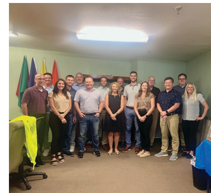
L&P 地板产品公司 (L&P Flooring Products), 美国