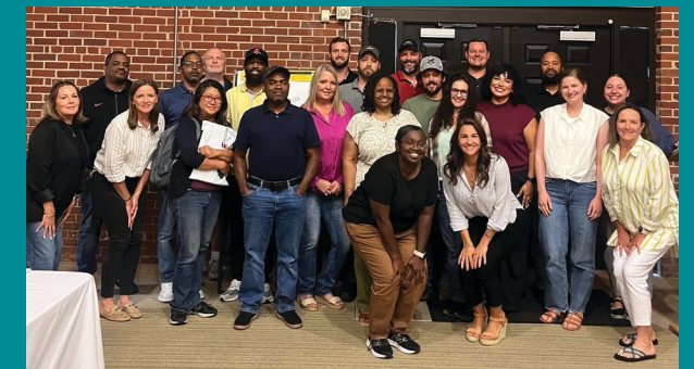
Skupina polaznika programa Foundational Leadership u Hanesu, Conover, Sjeverna Karolina

Zahvalni smo svakom lideru koji je sudjelovao u programu Foundational Leadership i obvezao se biti najbolji što može, za sebe i svoje timove!