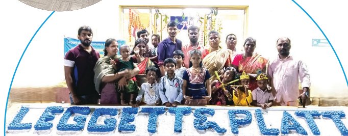
Indijski tim slavi Navaratri