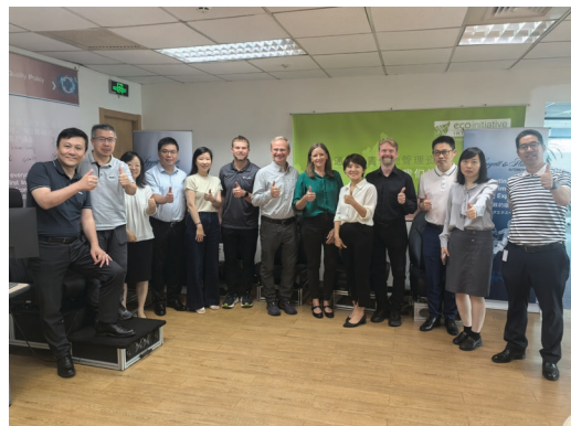
Međunarodna trgovina L&P-a, Kina

Slušamo i djelujemo i putem LPVoice-a. Kada smo krajem prošle godine pokrenuli LPVoice, primili smo više od 8.000 odgovora koji su pružili uvid u ono što radimo dobro i gdje možemo napredovati. Lideri poslovnih jedinica i odjela Korporativnog ureda iskoristili su te odgovore za izradu individualiziranih planova djelovanja koji jačaju prepoznavanje zaposlenika, nude više prilika za rast i razvoj te povećavaju angažman i suradnju. Kasnije ove godine naš će Odjel za ljudske resurse Korporativnog ureda provjeriti napredak tih planova i podijeliti ažuriranja putem internih komunikacija.