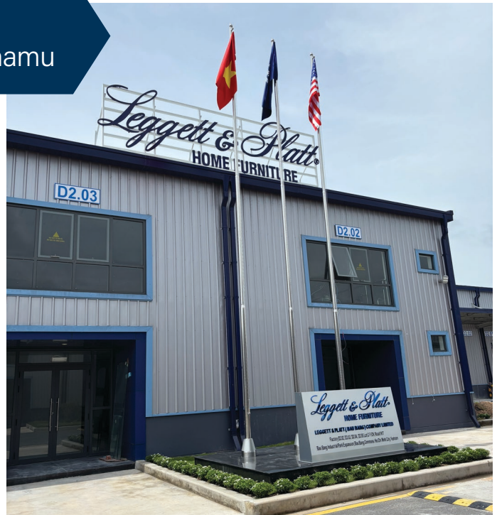
Ispred podružnice Namještaj za dom tvrtki Leggett & Platt u Bàu Bàngu

“Ovakav napor ne može postići jedna osoba, odjel ili poslovna jedinica. Potrebna je suradnja marljivih, talentiranih ljudi,” rekao je Adam.