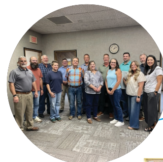
IT tim na okupljanju povodom igre Potraga za blagom