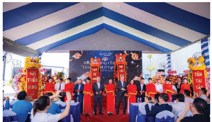
Ceremonia de inauguración de la sucursal de Muebles para el hogar en Bàu Bàng

Gracias a este trabajo en equipo, la sucursal de Muebles para el hogar de L&P en Bàu Bàng celebró su ceremonia de inauguración el 10 de octubre e inició sus operaciones oficialmente el 14 de octubre. Este hito refleja la dedicación de nuestros equipos y su compromiso para entablar relaciones sólidas que no solo ponen a las personas en primer lugar, sino que también continúan expandiendo nuestros negocios en todo el mundo.