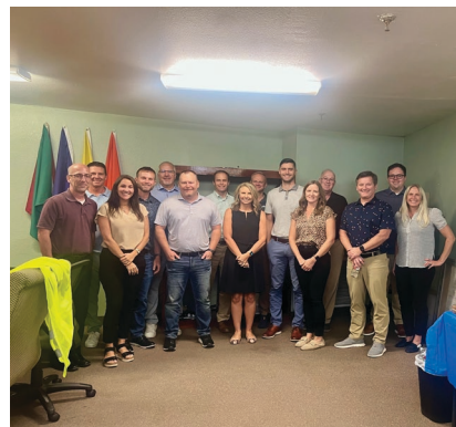
L&P Productos para pisos (Flooring Products), EE. UU.

Nuestro agradecimiento a todos los líderes que hayan participado en Foundational Leadership y se hayan comprometido a ser su mejor versión, tanto para ellos como para sus equipos.