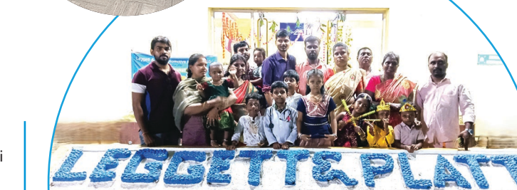
El equipo de India celebrando Navaratri