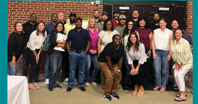
Cohorte del programa Foundational Leadership en Hanes, Conover, Carolina del Norte