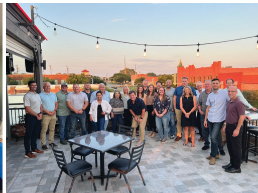
Ennis Spring, EE. UU.